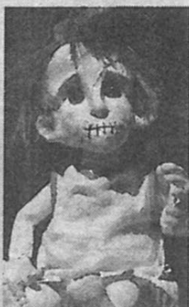
Mon père, ma guerre.

Aux Giboulées de la marionnette, la compagnie Tro-Héol s'est souvenue de la guerre d'Espagne et du joug de la dictature franquiste, dans Mon père, ma guerre.