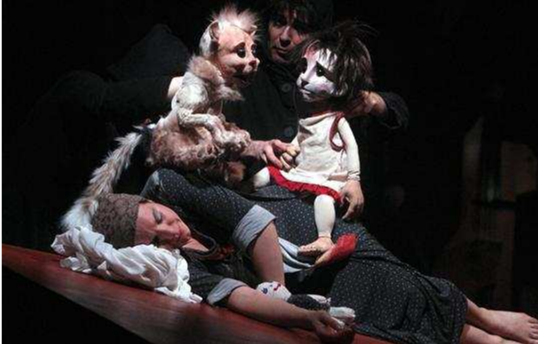
« Mon Père, ma guerre », samedi, une des propositions les plus fortes du festival.

La 20e édition de Momix s'achèvera en apothéose mardi, avec une représentation unique du spectacle du théâtre russe Licedei, Semianyki. Retour sur ce dernier week-end, riche en émotion et en récits autobiographiques.