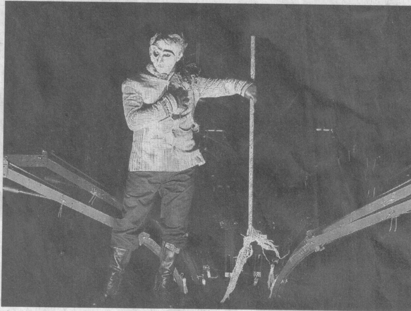
Mon père, ma guerre : émouvante création de la compagnie Tro Heol.

Comme le monde moderne aime bien tout mettre dans des cases, on a donc classé le spectacle sur l'étiquette « jeune public ». Pourquoi pas? Et pourtant quoi de plus difficile que de raconter à des enfants de 12 ans, la guerre d'Espagne, la cruauté d'un carnage dans lequel le frère tue le frère, le franquisme et ses 40 années de peur suintante comme un jambon andalou dégoulinant de graisse acide.